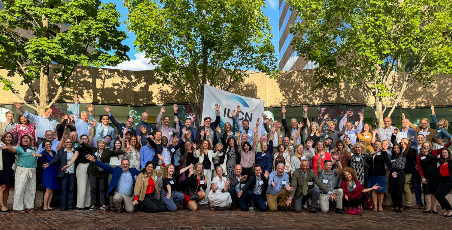
Razan Al Mubarak en el Foro Regional de Conservación de EE.UU., en Washington, DC.